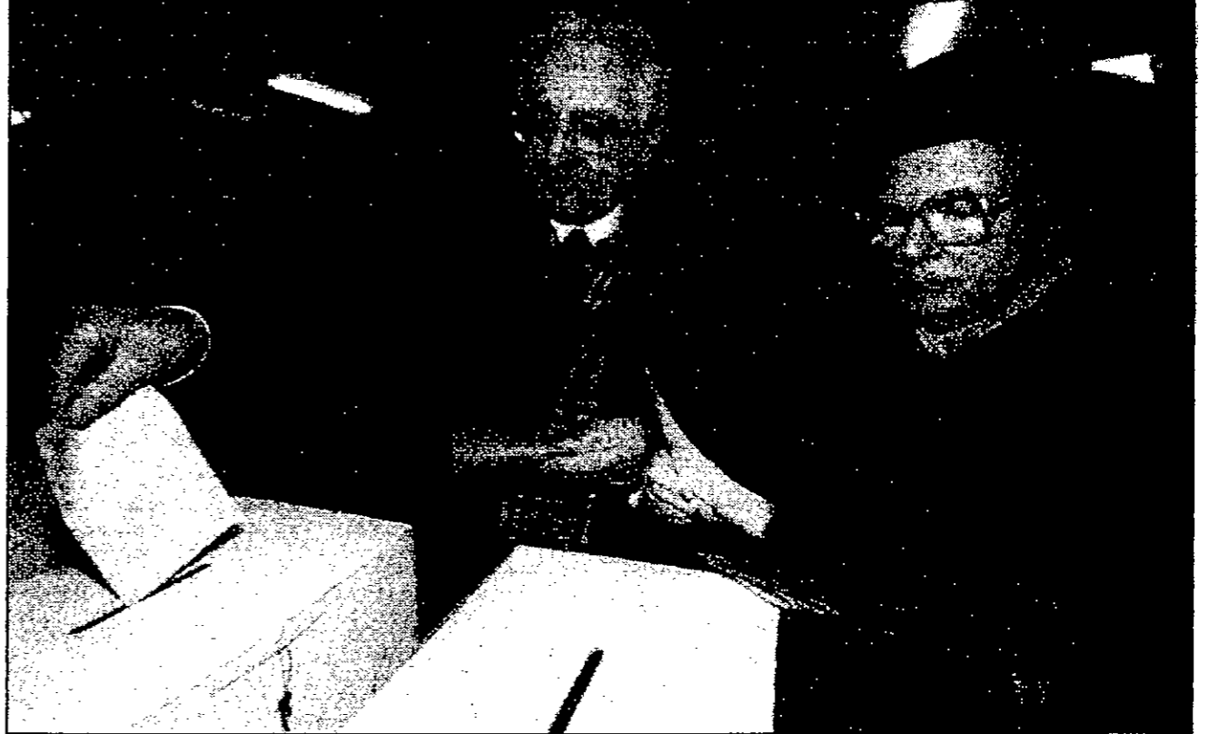
الرئيس الكرواتي تويجمان وزوجته انكيتسا يقترعان في زغرب امس

في هذه الاثناء أعلنت الادعاء الكرواتية في زغرب ان ميناء دوبروفنيك السيفياني التاريخي تعرض لثلاثين انفجاراً متتالية تحت سيطرة الصرب داخل اراضي البوسنة امس واكتت ميليشيا صرب البوسنة ايضا وقوع قتلى في محيط دوبروفنيك المجاورة للبوسنة، وان جندياً صربياً قتل بعدما تعرض لثلاثين كرواتية اول من امس السبت رغم الهبة التي أعلنت منذ اكثر من اسبوعين. ومن جانبها، نقلت وكالة صرب البوسنة للانباء عن مصادر ميليشيا صرب زعمها ان موالفها تعرض لثلاثين انفجاراً متتالية من جناب المسلمين واسلمة صغيرة من البوسنة خلال الايام الاخيرة. لكنها لم ترد على هذه الاستفزازات. عكس اشارت الادعاء الكرواتية انه لم تردها تقارير عن وقوع اصابات او اضرار في دوبروفنيك، ولم يتبين